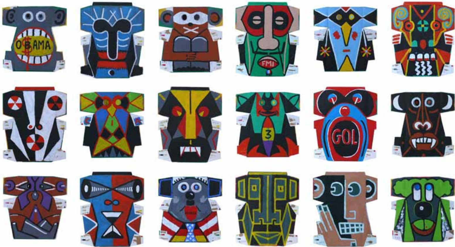
Manolo Quejido (Sevilla, 1946) Políticos , 2011. (nrs. 1 a 9) Acrílico sobre cartón. Varían 27,5 x 27,2 y 31,7 x 27,2 cm.