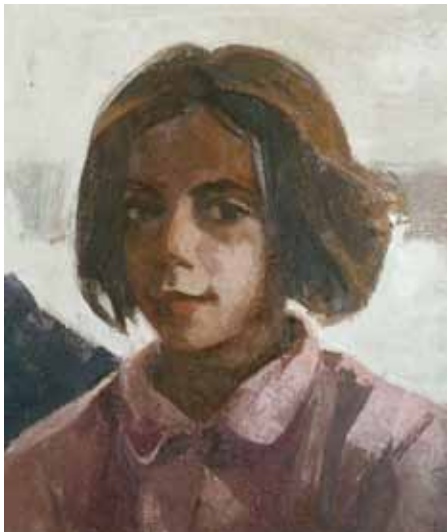
Carlos García-Alix (León, 1957) María , 2005. Óleo sobre lienzo. 46 x 38 cm.