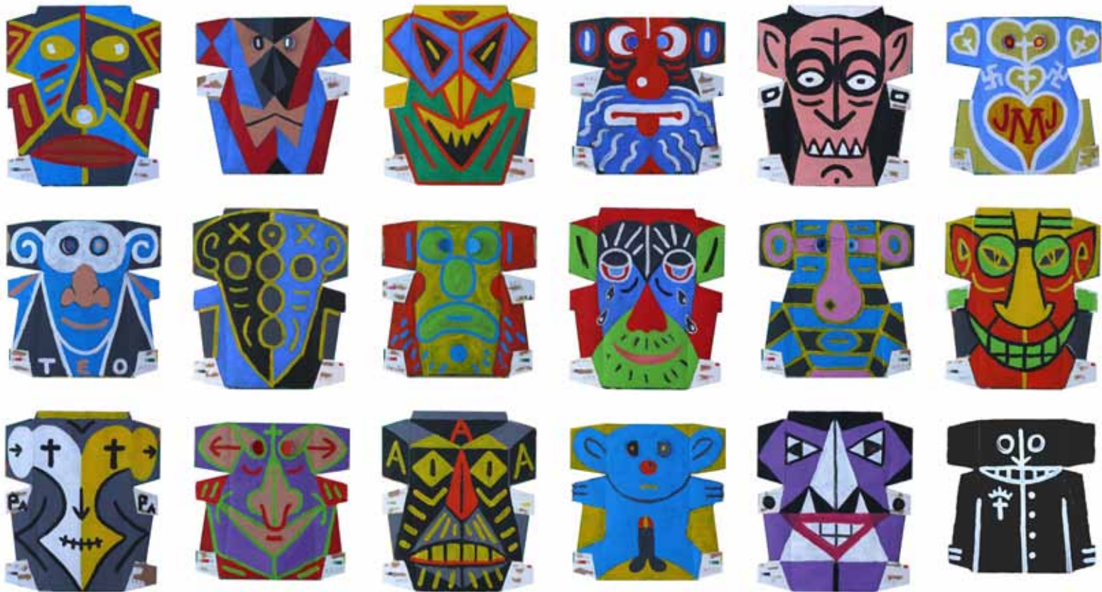
Manolo Quejido (Sevilla, 1946) Políticos , 2011. (nrs. 37 a 45) Acrílico sobre cartón. Varían 27,5 x 27,2 y 31,7 x 27,2 cm.