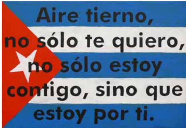
Manolo Quejido (Sevilla, 1946) Bandera , 2008. Acrílico sobre lienzo. 50 x 73 cm.