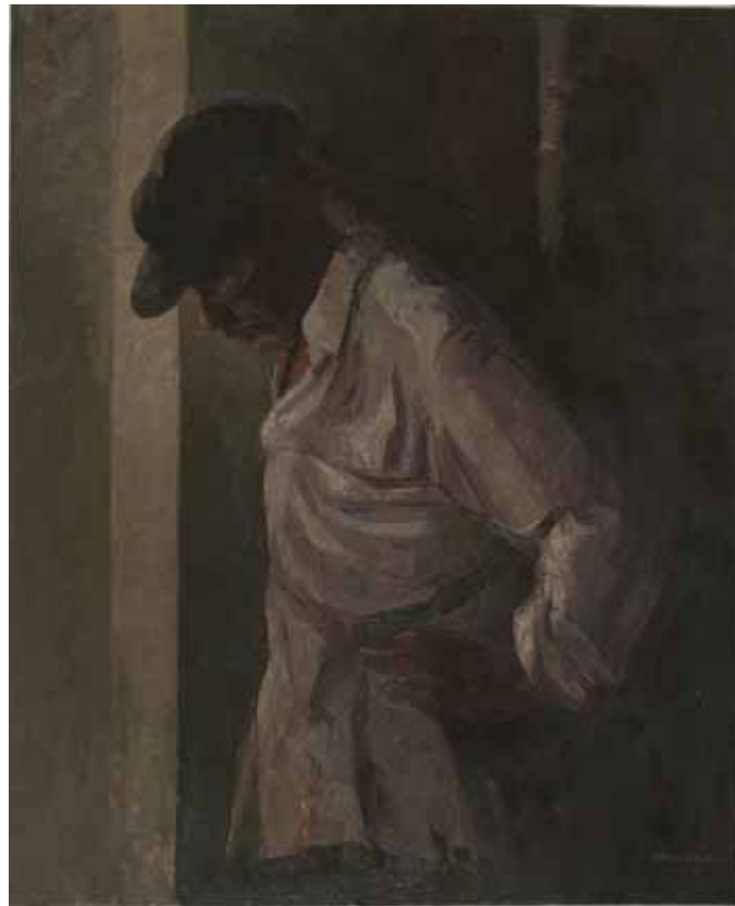
Carlos García-Alix (León, 1957) Erdosain , 2008. Óleo sobre lienzo. 100 x 81 cm.