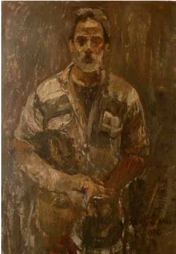
Carlos García-Alix (León, 1957) Autorretrato , 2010. Óleo sobre lienzo. 100 x 81 cm.