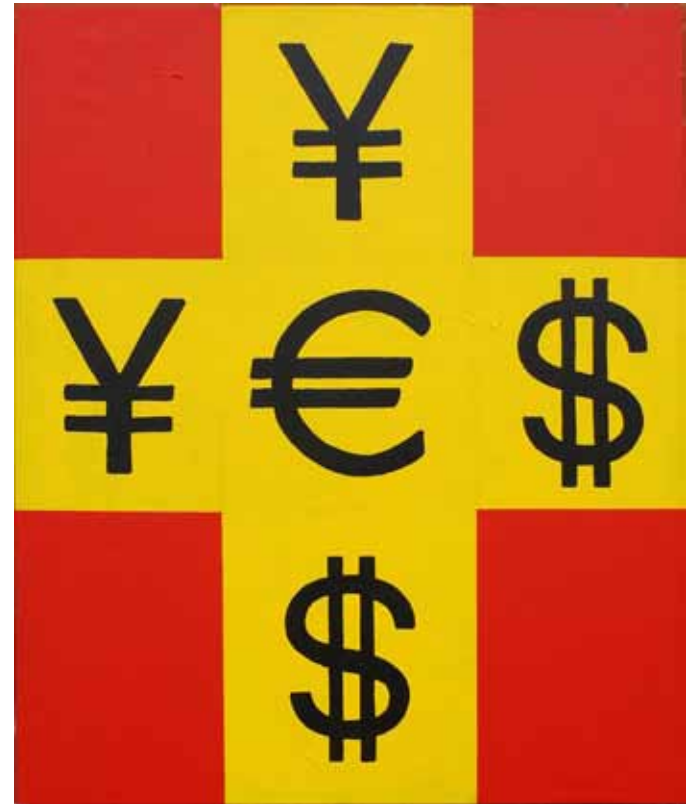
Manolo Quejido (Sevilla, 1946) Y€S , 2012. Acrílico sobre lienzo. 96 x 80 cm.