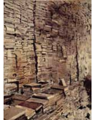
Carlos García-Alix. La biblioteca fantasma , 2002.