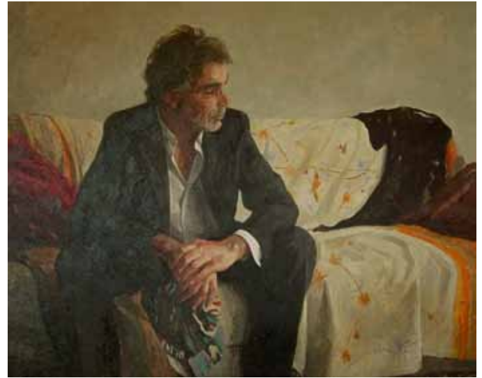
Carlos García-Alix (León, 1957) Autoretrato , 2009. Óleo sobre lienzo. 81x 100 cm.