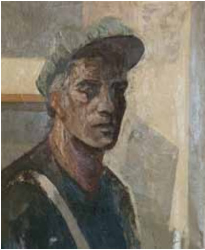
Carlos García-Alix (León, 1957) Autoretrato , 2008. Óleo sobre lienzo. 55 x 46 cm.