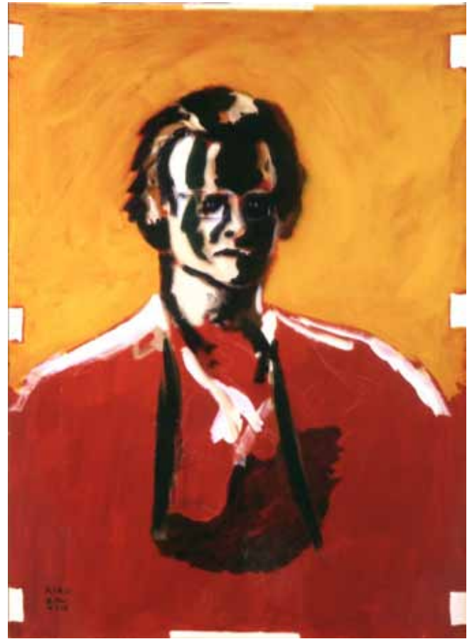
Manolo Quejido (Sevilla, 1946) Quico Rivas , 1978. Acrílico sobre cartulina. 100 x 72 cm. Propiedad del artista