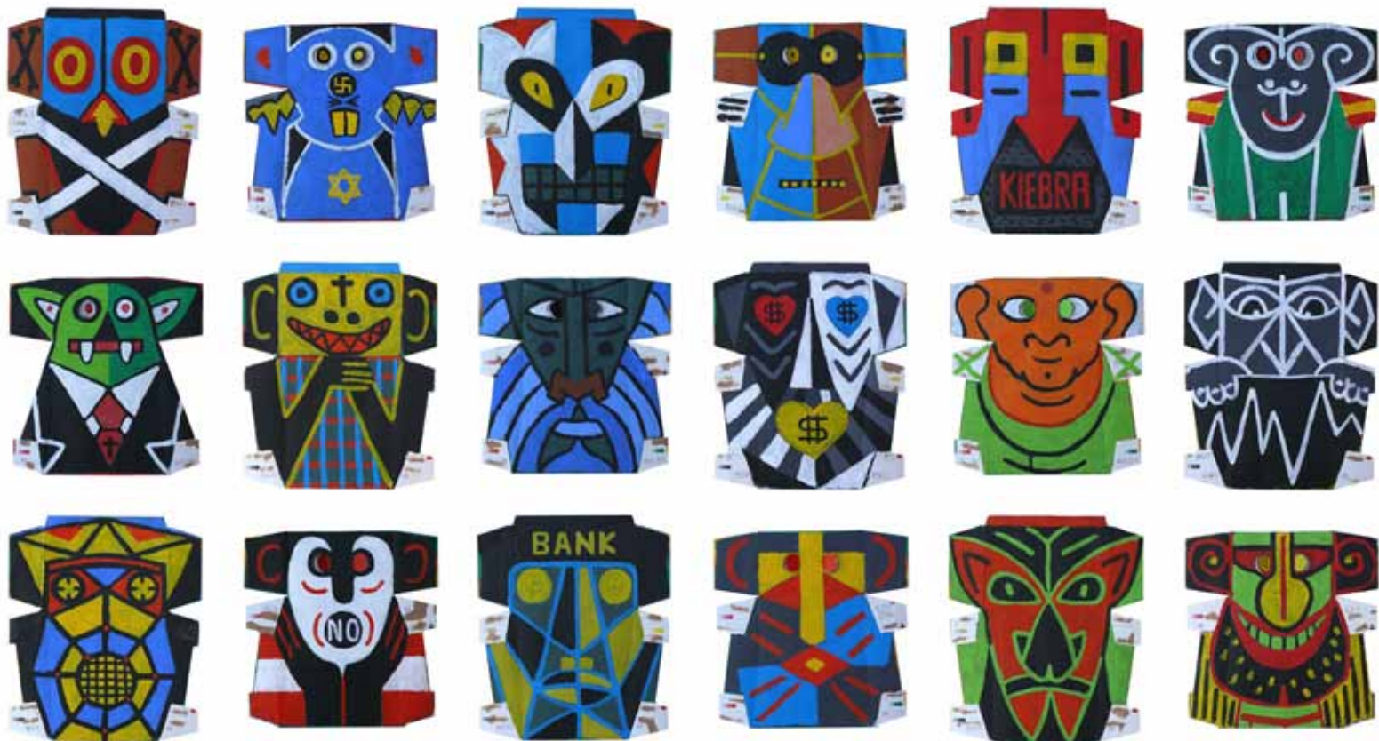
Manolo Quejido (Sevilla, 1946) Políticos , 2011. (nrs. 19 a 27) Acrílico sobre cartón. Varían 27,5 x 27,2 y 31,7 x 27,2 cm.